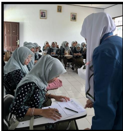
Melakukan pengarahannya pada kegiatan penelitian yang akan dilaksanakan dan pengisian lembar Informed Consent