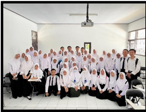
Foto Bersama Mahasiswa Prodi Sarjana Terapan Terapi Gigi Tingkat I Jurusan Kesehatan Gigi Poltekkes Kemenkes Tasikmalaya