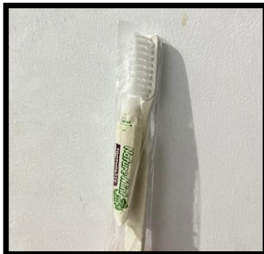
Pasta Gigi dan Sikat Gigi