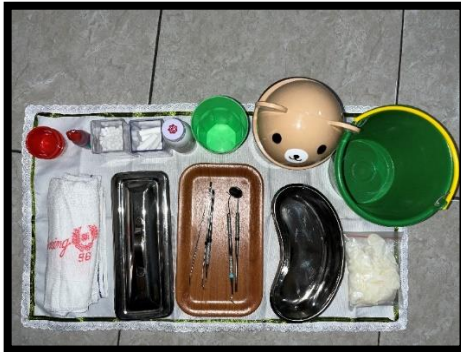
Alat dan Bahan Penelitian