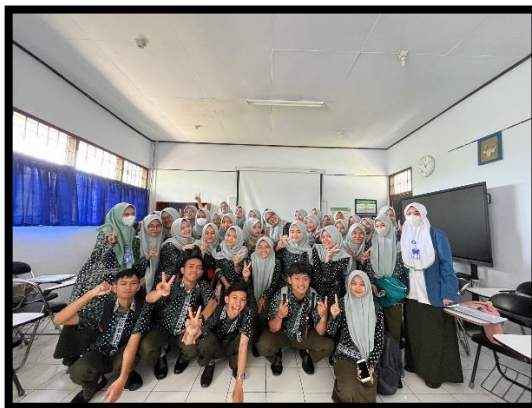
Foto Bersama Mahasiswa Prodi Sarjana Terapan Terapi Gigi Tingkat I Jurusan Kesehatan Gigi Poltekkes Kemenkes Tasikmalaya