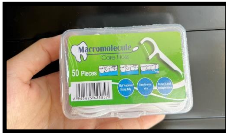
Benang Gigi Pegangan Khusus