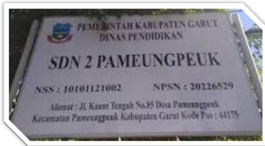
SDN 02 Pameungpeuk Kabupaten Garut