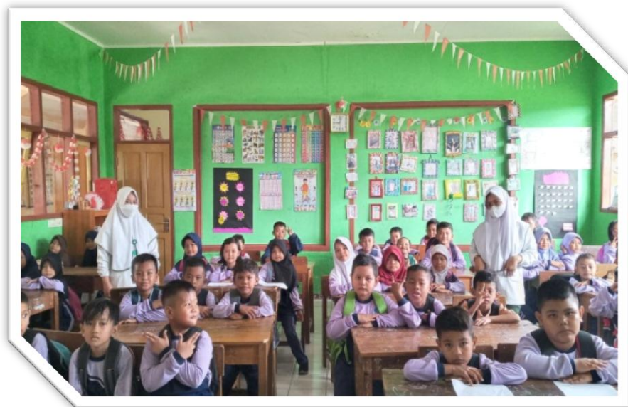
Foto bersama siswa kelas 1 SDN 02 Pameungpeuk