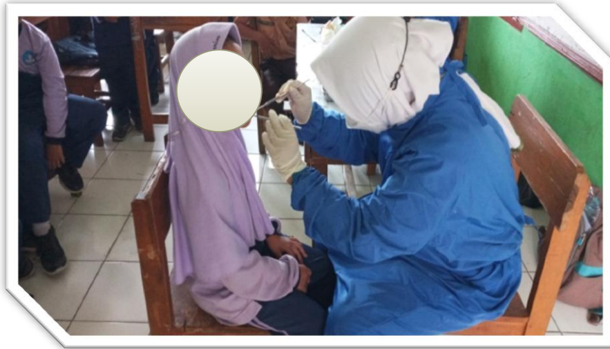
Pemeriksaan pada Siswa Kelas 1 SDN 02 Pameungpeuk