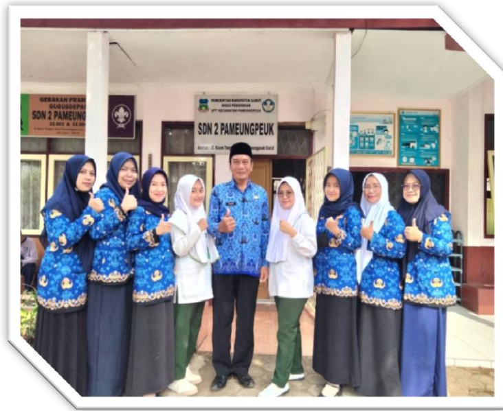
Foto bersama Kepala Sekolah dan Guru-Guru SDN 02 Pameungpeuk