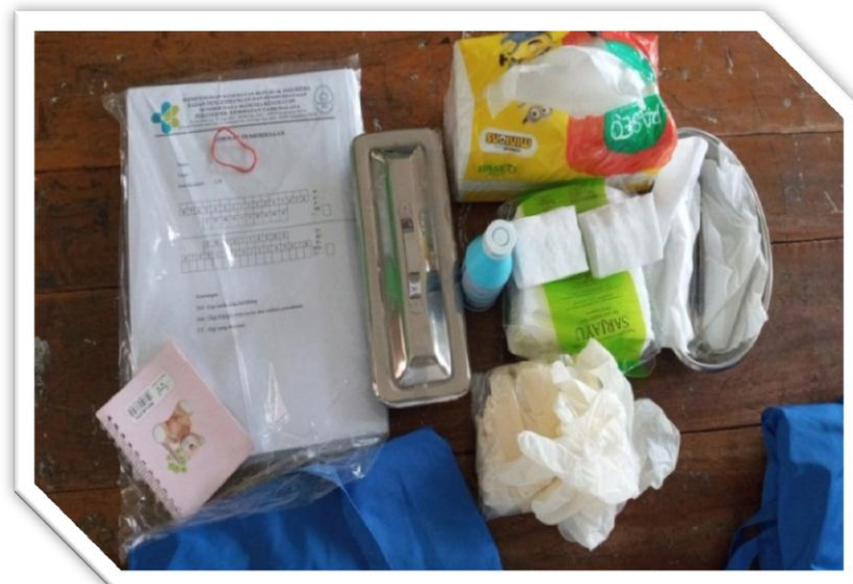
Persiapan Alat dan Bahan