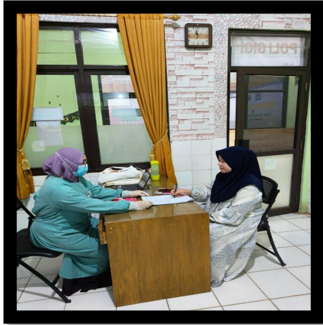
Pengisian kuesioner penelitian