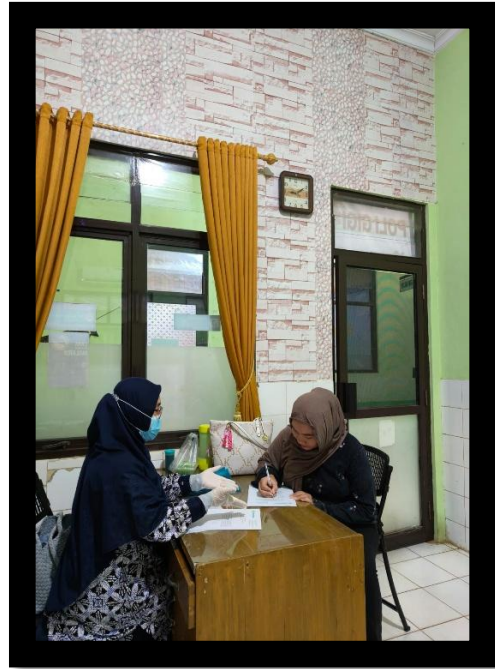
Pengisian lembar kuesioner pengetahuan kesehatan gigi dan mulut