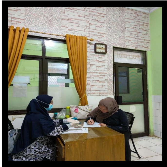
Proses Perkenalan, Menyampaikan Tujuan dan Melakukan Pendekatan. Pengisian Informed Consent.