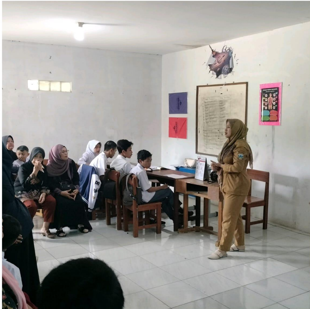
FOTO KEGIATAN PENYULUHAN TERHADAP KEMAMPUAN MENGgosok GIGI