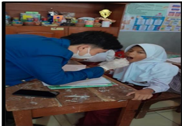
Pemeriksaan Karies M1