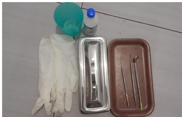
Alat Diagnostik Set