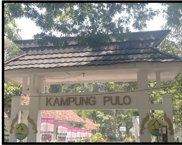
Gerbang Kampung Adat Pulo