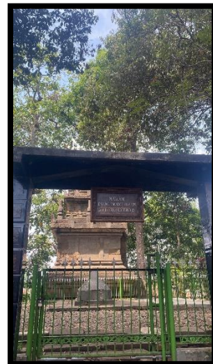
Makam Keramat Eyang Embah Dalem Arif Muhammad