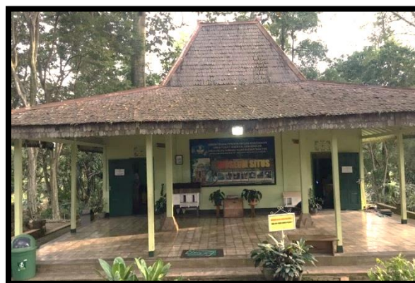
Museum Situs Kampung Adat Pulo