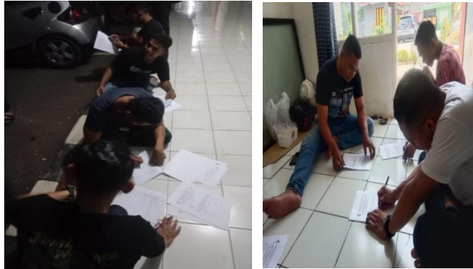
Pengisian Informed Consent dan Kuesioner