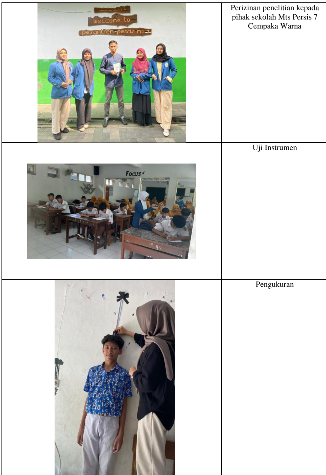
Gambar 2. Dokumentasi Penelitian