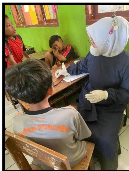
Pemeriksaan Intra Oral