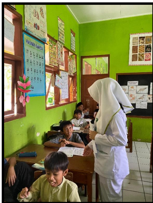
Membagikan lembar Inform Concent