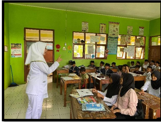
Menjelaskan tata cara pengisian kuesioner dan inform concent