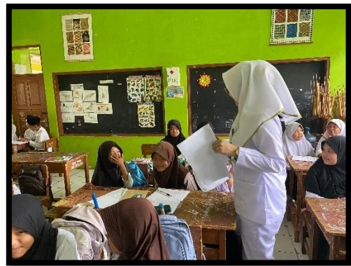
Membagikan lembar kuesioner