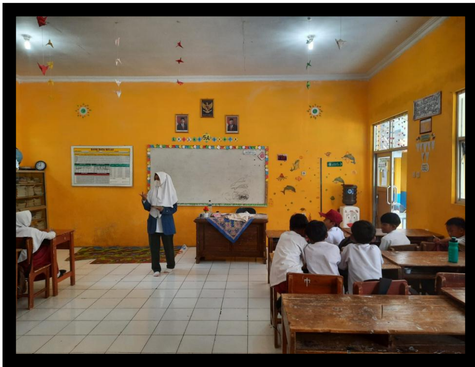
Gambar 5 dan 6 Penyuluhan Media Permainan Puzzle