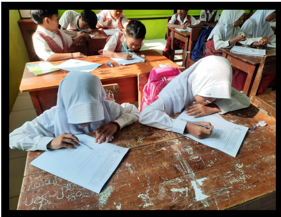
Gambar 4 Pengisian Kuesioner