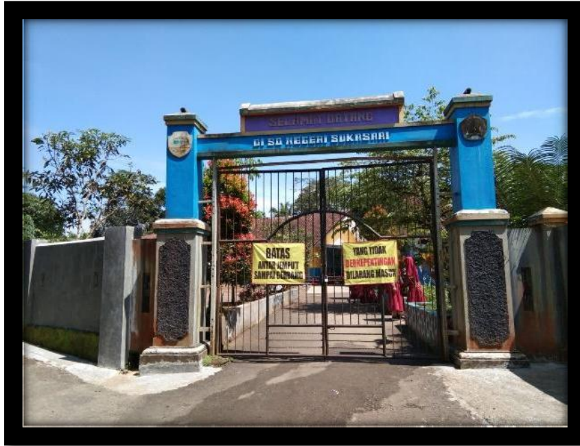
Gambar 1 Lokasi Penelitian