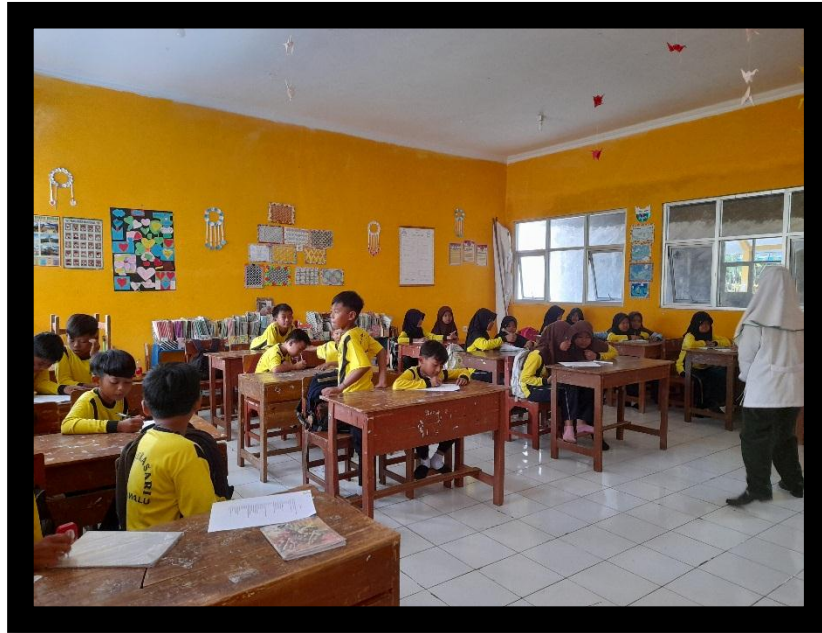
Gambar 1: Survei Awal