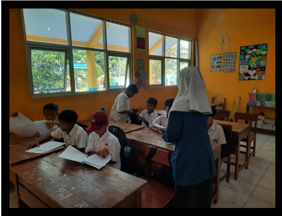
Gambar 3 Pembagian Kuesioner