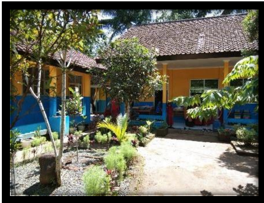
Gambar 2 Halaman depan sekolah