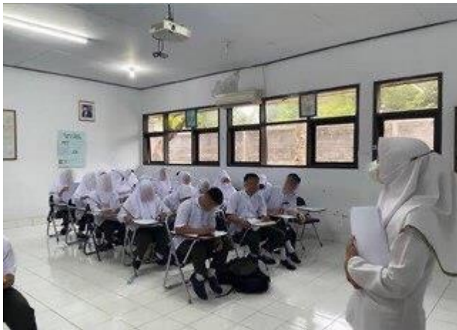
Pengisian Informed Consent