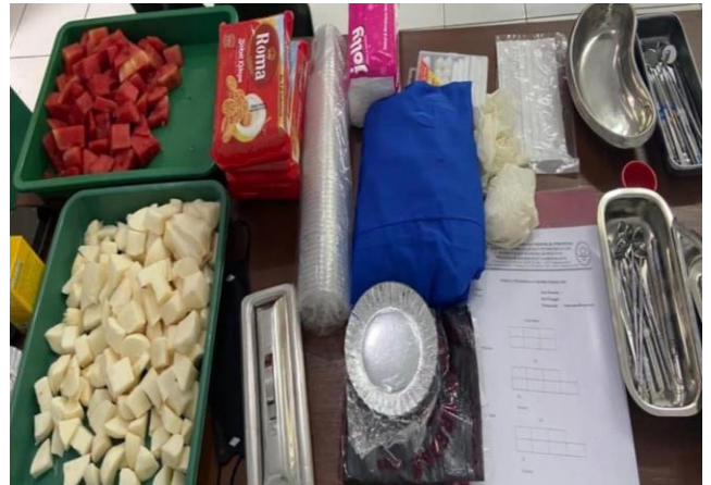
Alat dan Bahan Penelitian