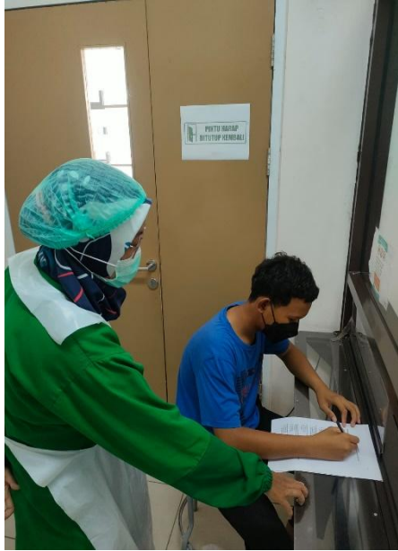
Pengisian kuesioner Perilaku Menyikat Gigi