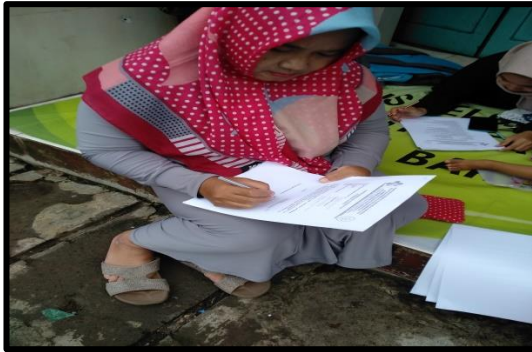
Pengisian Lembar Informed Consent