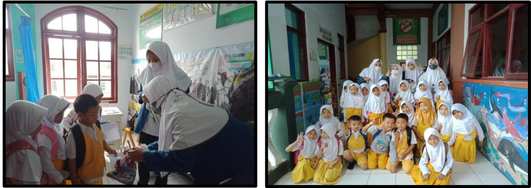
Foto Bersama Guru RA PUI Kawalu